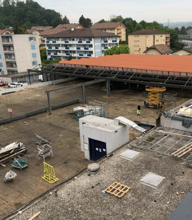
Démantèlement de l'entrepôt