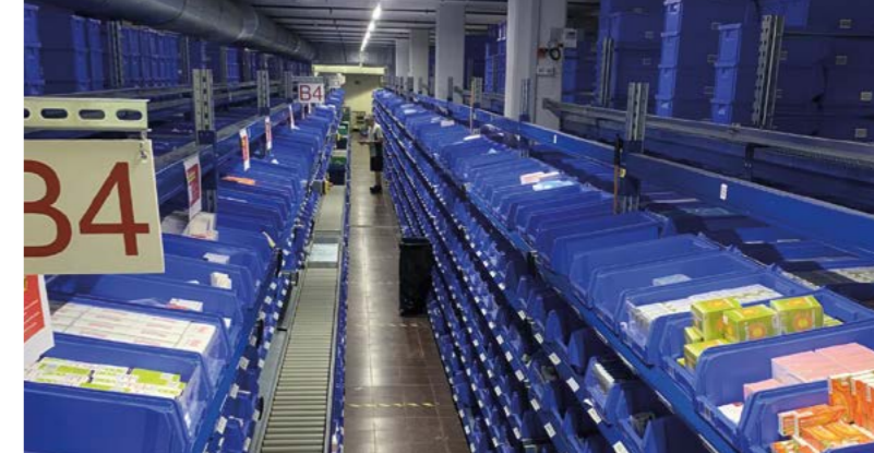
Le stock du sous-sol après les travaux de transformation.