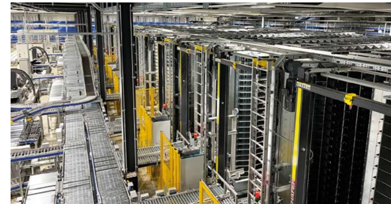
Nouveaux carrousels d'entreposage